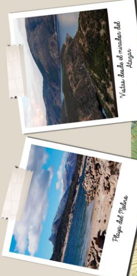
Playa del Molino

La Senda del Genaro es una de las propuestas turísticas más completas y recomendables de toda la Sierra Norte de Madrid. Conecta los lugares de mayor atractivo y todos los municipios que rodean al embalse de El Atazar, atravesando parajes y entornos de gran valor natural. Esta espectacular ruta circular está incluida en la red de Sendas Verdes de la Comunidad de Madrid. El recorrido, de más de 70 km de longitud, está muy bien señalizado y se divide en 7 etapas diferentes. Es un Gran Recorrido GR-300, y toda la ruta está señalizada con marcas blancas y rojas. Cuenta además con paneles informativos, en cada localidad y en diversos puntos de interés. Fue el primer Gran Recorrido en discurrir íntegramente por la Comunidad de Madrid. Se pueden recorrer tramos concretos, entre los diferentes pueblos de la Mancomunidad, o bien realizar la ruta completa, en dos o tres jornadas. Su icono caracterizador es el famoso muñequito azul. Genaro, presente en todo el recorrido y seña de identidad de la casa.