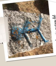
Sedificatorio minero del Genaro