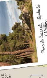
Pinar de Casado - Senda de El Villar