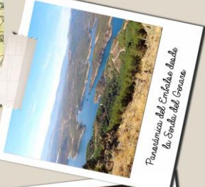
Panorámica del Embalse desde la Senda del Genaro