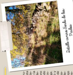
Detalle cercano Senda de las Pozas

Partiendo de la Plaza de los Arzobispos o Plaza de la Ermita, junto al mirador del embalse, seguimos la carretera que desciende hasta las instalaciones del Área Náutica de Cervera. Pasando el acceso al Área, iremos por la carretera unos 500 mts. y nos encontraremos con un camino que se desvía a la izquierda. Este es el Camino del Molino y continuando por él llegaremos al embalse, bajo cuyas aguas está sumergido el antiguo molino. La ruta finaliza en la mejor playa que tiene el embalse en el término municipal de Cervera del Villar, la Playa del Molino. Desde aquí, nos vamos a la izquierda y seguimos el camino que nos lleva al mismo camino, pero no es circular, pero la caminata vale la pena por las impresionantes vistas y el tranquilo del entorno.