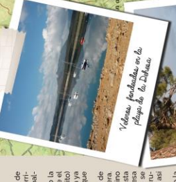
Vallejo finalizada en la Playa de la Dehesa