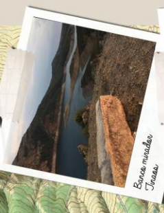
Banca mudada Jirasa