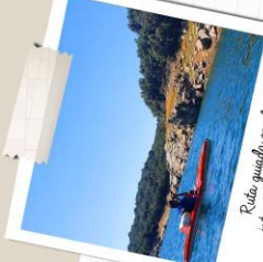
Ruta subida en kayak interpretando la naturaleza

Salimos del Restaurante el Lago, bajando por la principal y a unos 200 metros llegamos a la zona de las Arcas. Desde aquí, seguiremos la ruta de Gran Recorrido senda del Genaro que se dirige a la presa de El Villar. En la zona del antiguo lavadero, la senda gira a la izquierda. Allí toma el camino del Conocido, una pista de tierra que bordea el embalse y que tiene una barrera para impedir el paso de vehículos no autorizados. El camino se transforma en senda en el momento en el que se cruza el límite municipal con Cervera del Villar y Robledo de la Jara. Tras pasar un zarzo, la ruta continúa por el camino bien marcado hasta las proximidades de la carretera M-127, donde se desvía a la derecha de la senda. Como es lógico, el camino continúa por la vía pecuaria Colada de Vallejo Rubio. La senda continúa hacia el centro del núcleo urbano dejando a la izquierda un antiguo descamisador para el ganado, trasmueño denominado de Las Eras y a la derecha un orrijo para caballos.